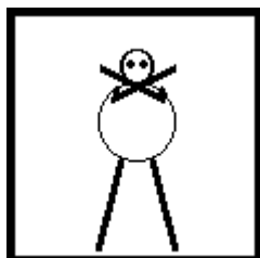
Canceladas todas las instrucciones anteriores. Espere.