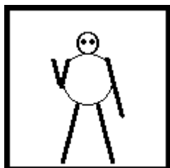
Manténgase en tierra; siga las instrucciones de mi mano derecha.