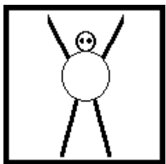
Ya puede despegar.